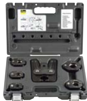
De inhoud van de koffer bestaat uit 5 persringen met afmetingen 15 tot 35 mm en de scharniertrekklaauw Z1 met gepatenteerde scharnierfunctie. Een tweede koffer wordt aangeboden met scharniertrekklaauw Z2 en twee persringen met afmetingen 24 en 54 mm.