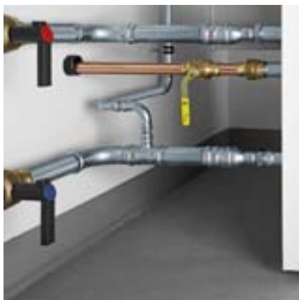
Raccordement de la chaudière : canalisations de départ et de retour avec Prestabo et les robinets à boisseau sphérique Easytop. Branchement au gaz avec Profipress G.