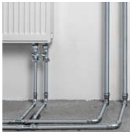
Prestabo est synonyme de polyvalence pour les installations de chauffage.